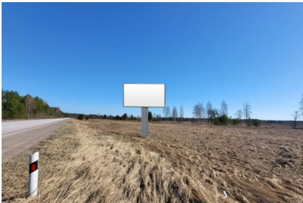
Место расположения рекламной конструкции

двусторонний щит – билборд формата 6,0 x 3,0 м