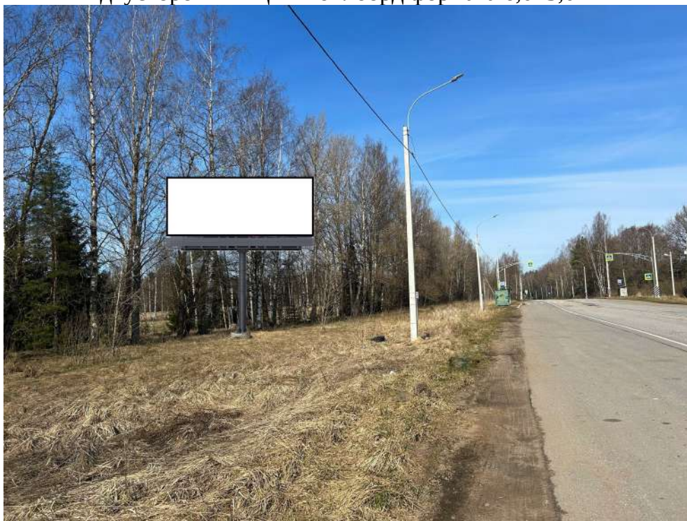
Место расположения рекламной конструкции

Тип и размер, предлагаемой к установке, рекламной конструкции: двусторонний щит – билборд формата 6,0х3,0 м