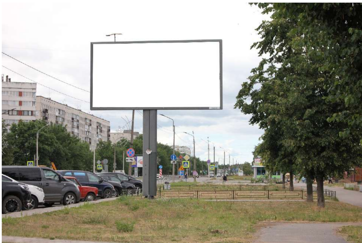
Фото места размещения