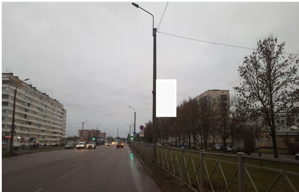
Место расположения рекламной конструкции

Тип и размер, предлагаемой к установке, рекламной конструкции: консоль двусторонняя формата 0,8 x1,2, на электрической опоре освещения