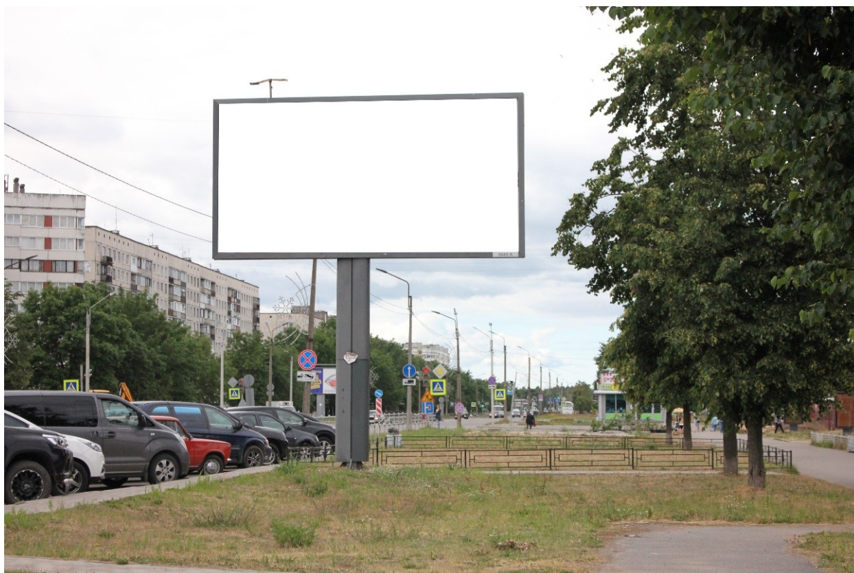
Фото места размещения