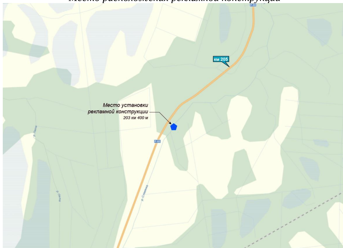
Схема места расположения рекламной конструкции