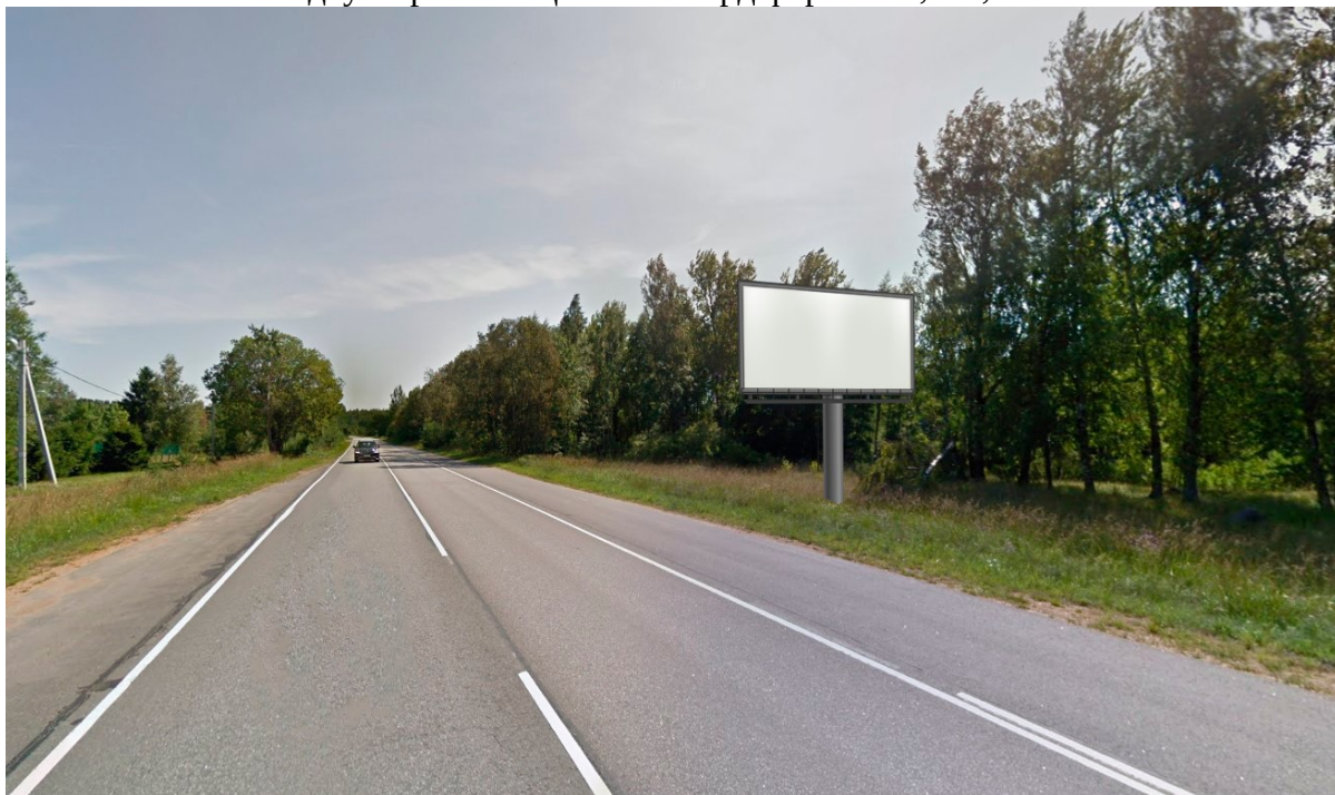
Место расположения рекламной конструкции

двусторонний щит – билборд формата 6,0х3,0 м