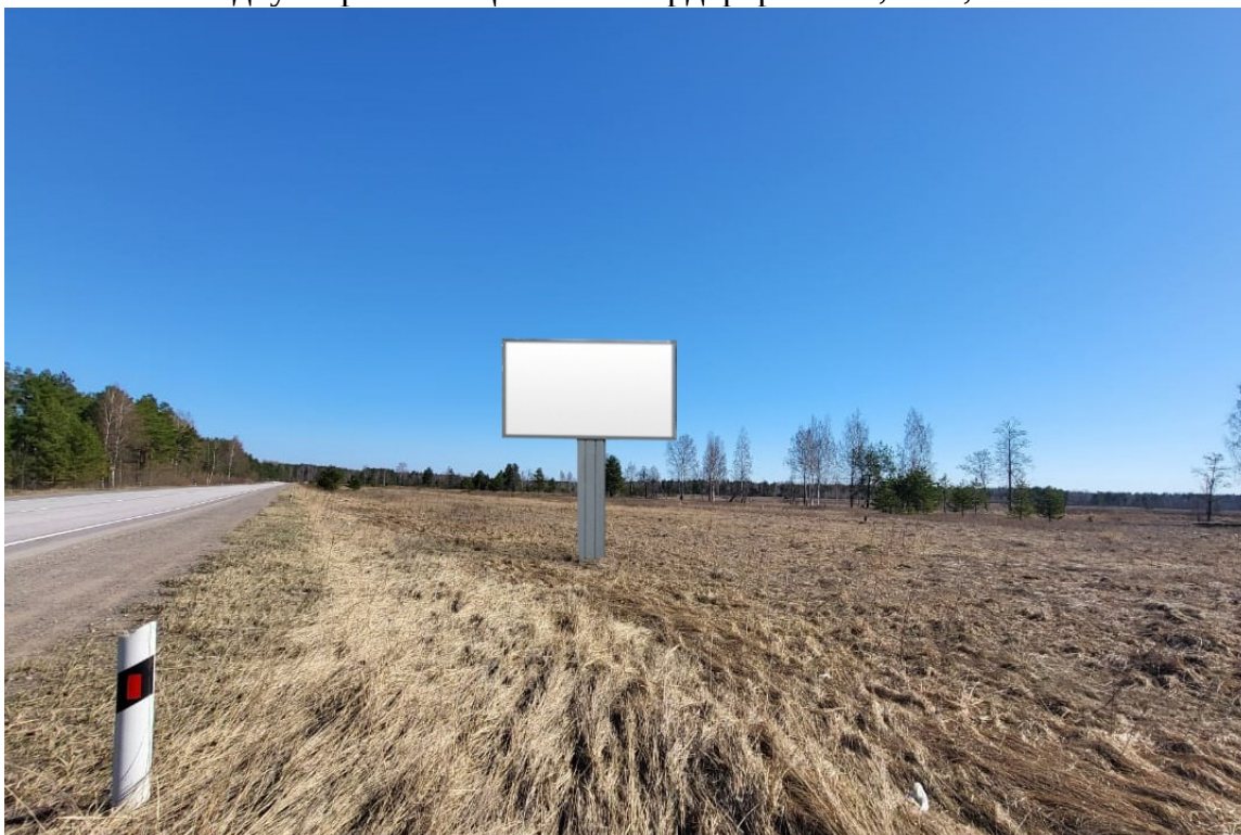
Место расположения рекламной конструкции

Тип и размер предлагаемой к установке рекламной конструкции: двусторонний щит – билборд формата 6,0 x 3,0 м