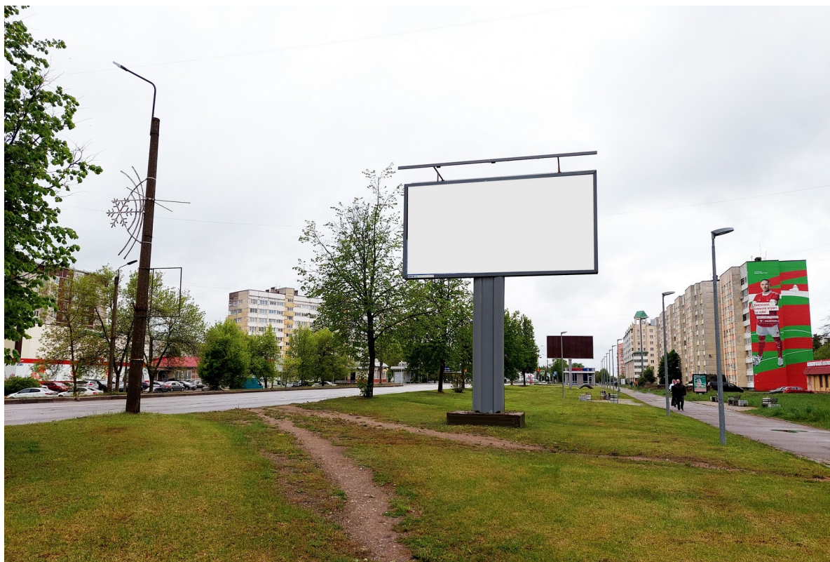
Место расположения рекламной конструкции

Тип и размер предлагаемой к установке рекламной конструкции: отдельно стоящий двусторонний щит – билборд 6х3 м