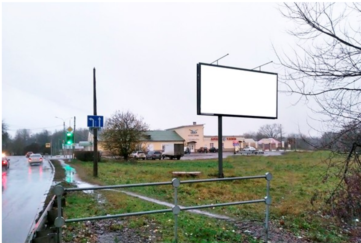
Место расположения рекламной конструкции

Тип и размер предлагаемой к установке рекламной конструкции: отдельно стоящий двусторонний щит – билборд 6х3 м