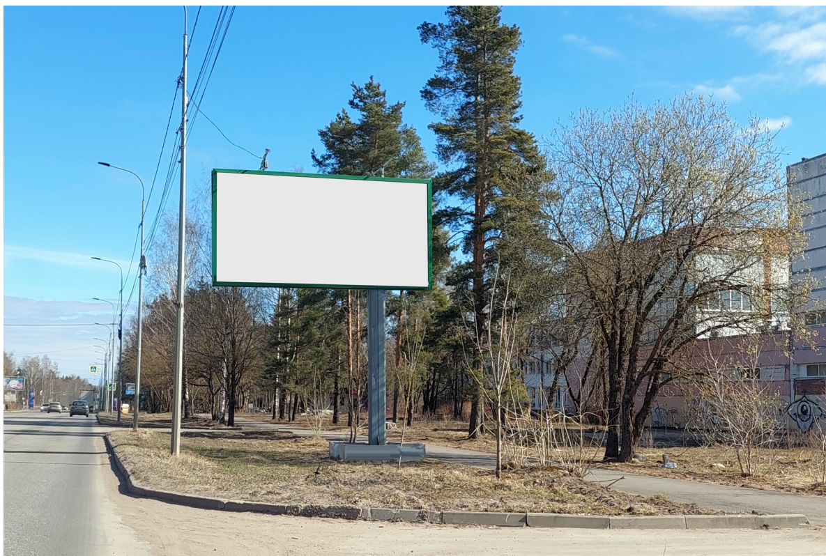
Место расположения рекламной конструкции

отдельно стоящий двусторонний щит – билборд 6х3 м