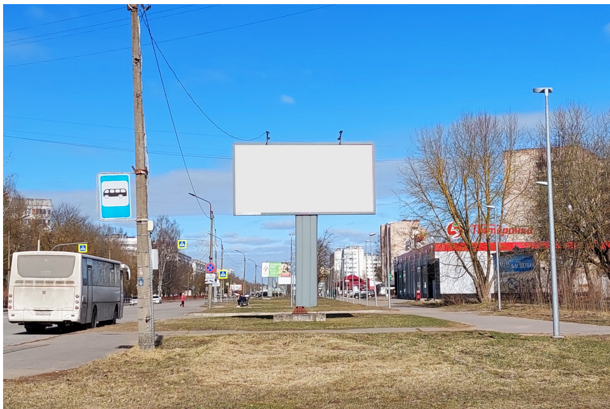
Место расположения рекламной конструкции

Тип и размер предлагаемой к установке рекламной конструкции: отдельно стоящий двусторонний щит – билборд 6х3 м