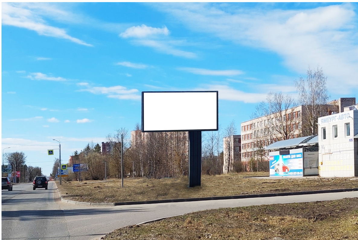
Место расположения рекламной конструкции

Тип и размер предлагаемой к установке рекламной конструкции: отдельно стоящий двусторонний щит – билборд 6х3 м