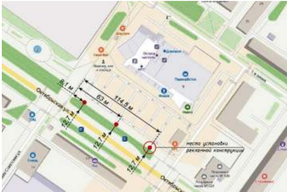
Место расположения конструкции

Тип и размер, предлагаемой к установке, рекламной конструкции: двусторонний щит – сити-формат формата 1,14 x 1,72 м