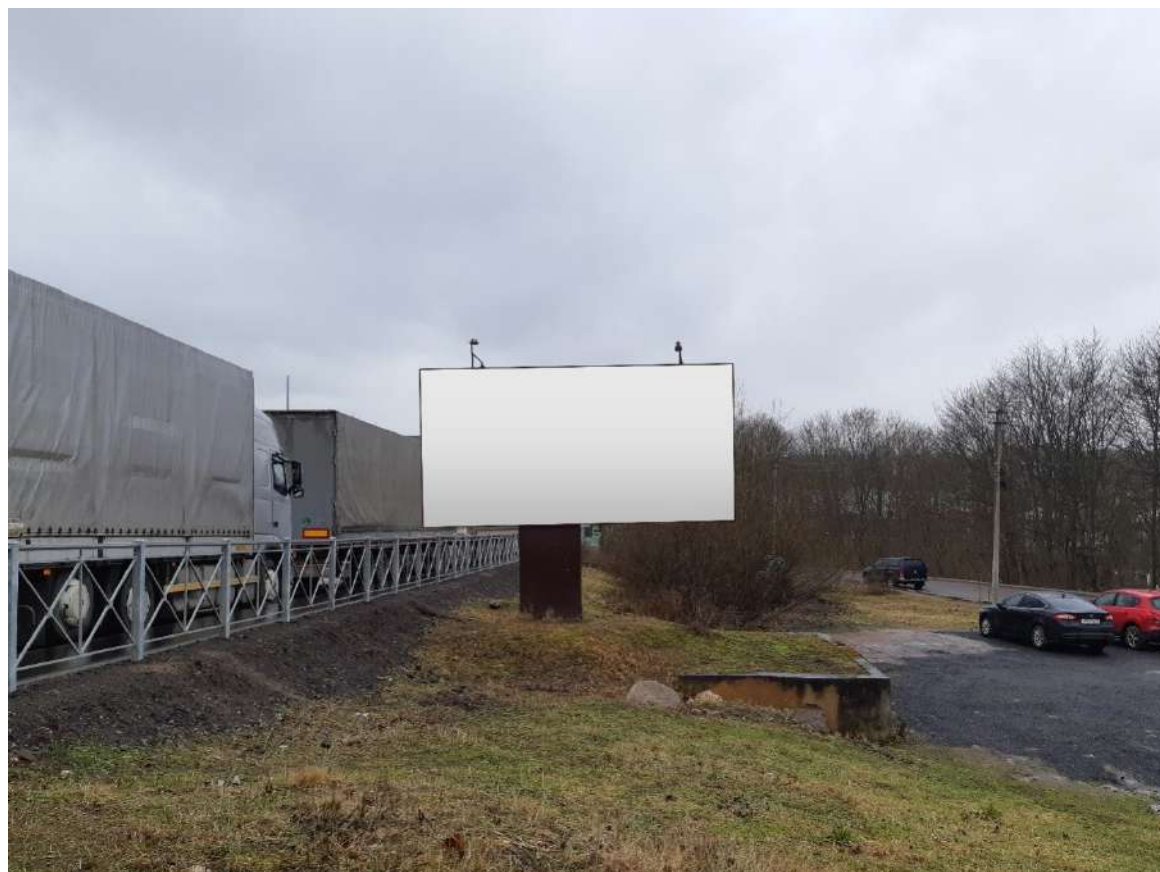
Фото места размещения