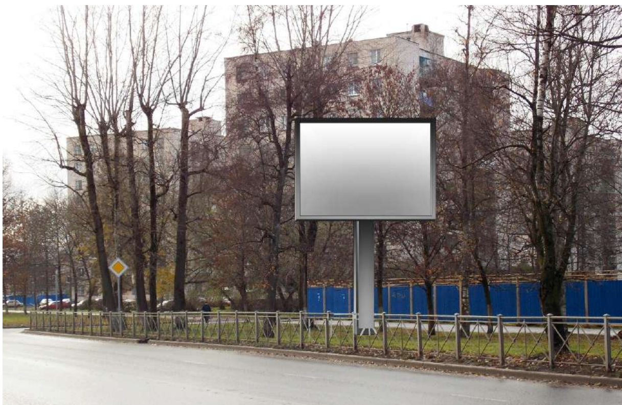
Фото места размещения