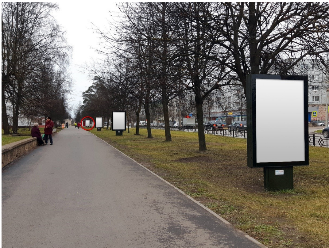
Фото места размещения