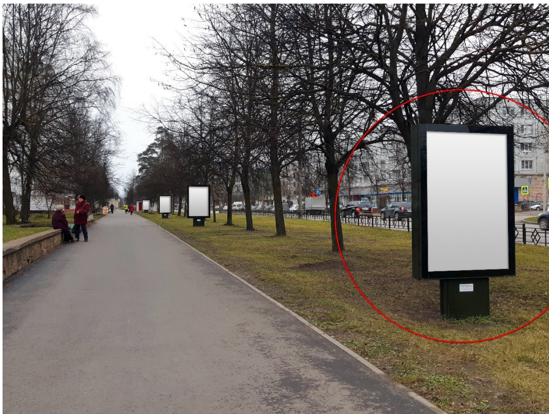
Фото места размещения