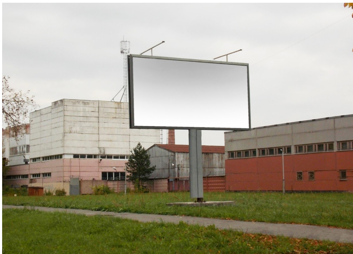
Фото места размещения