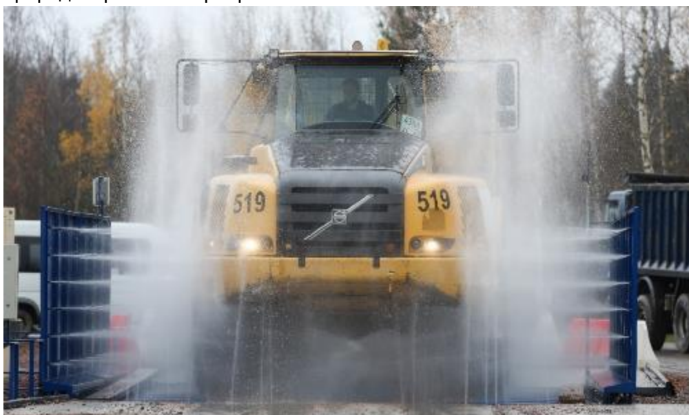
Рис. 14. Мойка колес на въезде в заказник (июль 2019 г.)

Сохранение биоразнообразия Кургальского заказника – один из главных приоритетов компании Nord Stream 2. С этой целью на стадии строительства газопровода, когда на флору и фауну оказывается наибольшее воздействие, реализуется ряд природоохранных мероприятий.