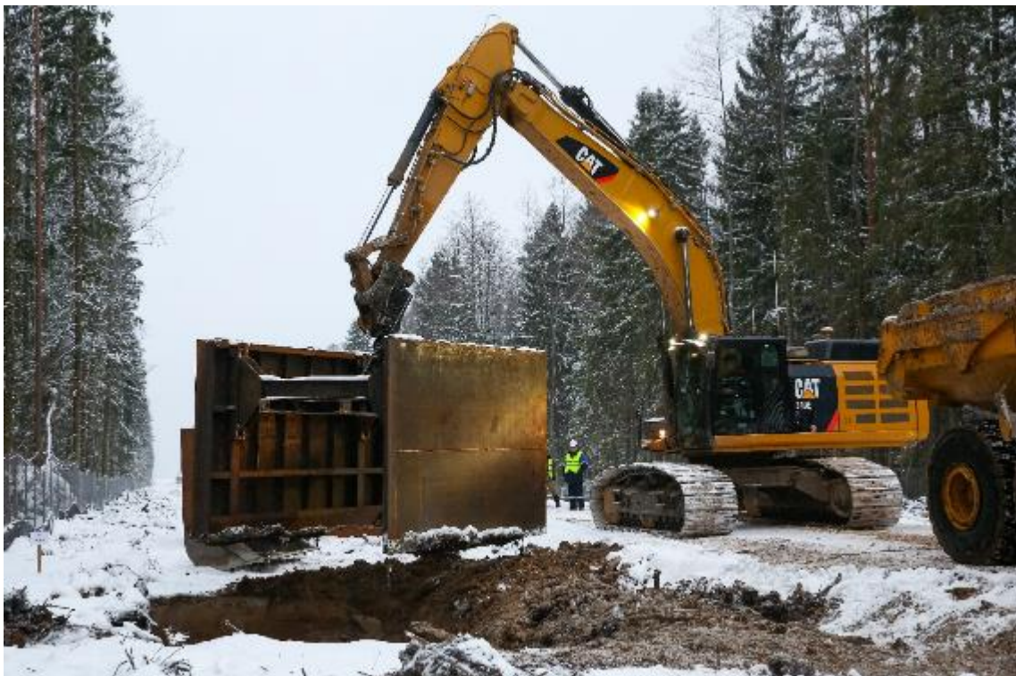
Рис 17. Техника, работающая с использованием биоразлагаемых смазочных материалов для минимизации воздействий на биоразнообразие (декабрь 2018 г.)

Также реализуется ряд мероприятий для исключения и минимизации воздействия на животный мир . В соответствии с перечнем, утвержденным компетентными органами