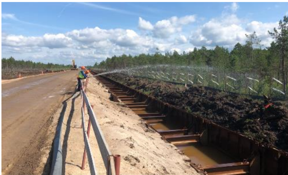
Рис. 9. Смачивание торфа, находящегося на хранении, для предотвращения его пересыхания и уплотнения (июль 2019 г.)

На время строительства, пока грунт хранится в извлеченном состоянии, одной из ключевых задач для обеспечения успешности рекультивации является максимальное сохранение характеристик верхних слоев торфа , в котором находятся семена растений: необходимо не допустить его пересыхания . С этой целью подрядчиками компании проводится регулярный полив торфа , находящихся на хранении.