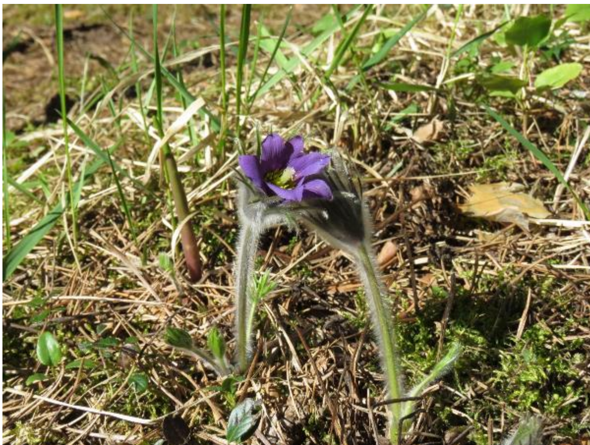
Рис. 12. Успешно пересаженный прострел раскрытый, Красная книга Ленинградской области (май 2019 г.)

Был также идентифицирован ряд охраняемых растений вблизи коридора строительства, в том числе за пределами Кургальского заказника. Пересадка данных экземпляров не предусматривалась, однако, их локации были огорожены и помечены информационными знаками.