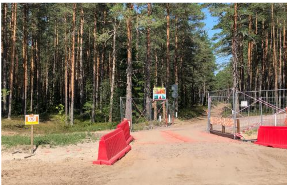
Рис. 19. Специальный коридор для прохода животных (июль 2019 г.)

Для обеспечения возможности пересечения трассы в районе реликтовой дюны, то есть приблизительно посередине линейного участка, был оборудован специальный коридор для прохода животных.