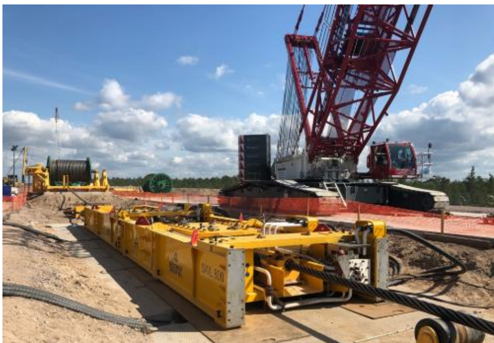
Рис. 4. Протягивание ниток газопровода при помощи мощной лебедки (июль 2019 г.)

Сочетание использования траншейных крепей и протягивания сваренных плетей трубопровода в обводненную траншею имеет целый ряд экологических преимуществ : поскольку траншеи не осушаются, сохраняется естественный уровень грунтовых вод , а значит и местный гидрологический режим , существенно сокращается использование тяжёлой техники , минимизируется уровень шума и другие воздействия на флору и фауну.