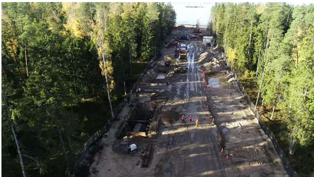
Рис. 2. На экологически чувствительном участке прибрежных лесов работы ведутся в коридоре шириной всего 30 м (октябрь 2019 г.)

На наиболее чувствительном участке (полоса прибрежных лесов протяжённостью 1,3 км) работы ведутся в коридоре шириной всего 30 м – это самый узкий из возможных коридоров для сооружения газопровода такой мощности. Для сравнения: при традиционном методе строительства ширина коридора составила бы 85 – 100 м . В районе реликтовой дюны ширина полосы отвода составила лишь 40 м .