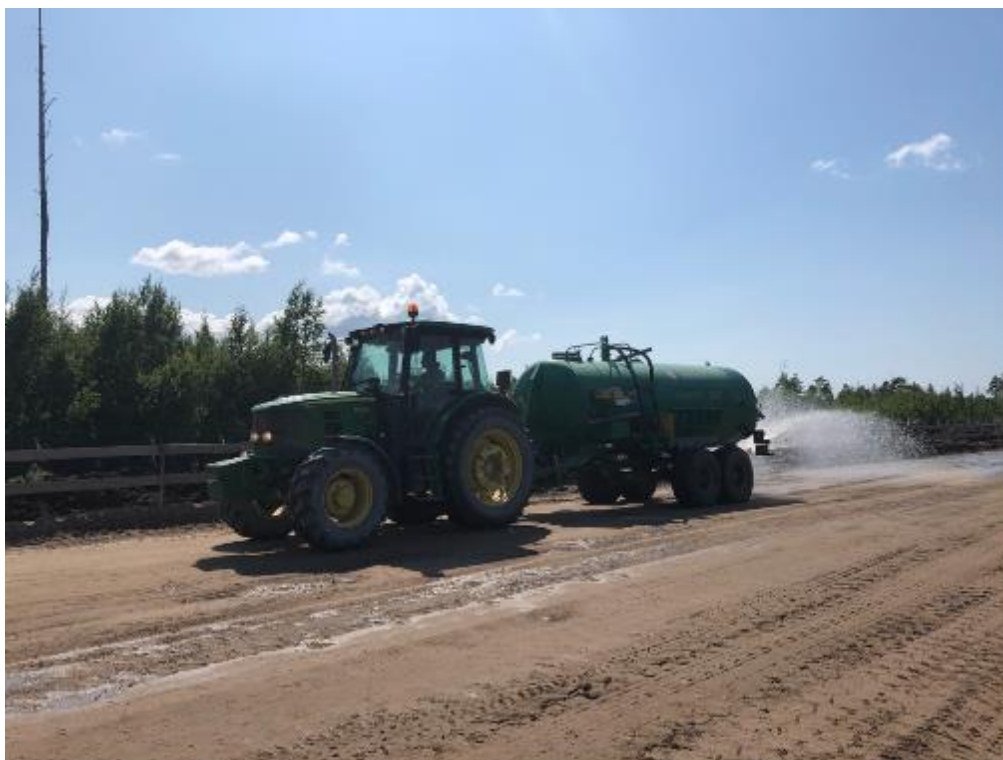
Рис. 15. Подавление пыли в сухую погоду (июль 2019 г.)

Одной из угроз биоразнообразию заказника является проникновение и распространение инвазивных (чужеродных) видов растений. Чтобы исключить занос семян каких-либо посторонних растений в заказник на колесах транспорта, используемого для перевозки грузов и выполнения строительных работ, компанией организованы пункты мойки колес для техники как на выезде (обычная практика, направленная, в первую очередь, на предотвращение загрязнения дорог общего пользования в районе строительства), так и на въезде в заказник.