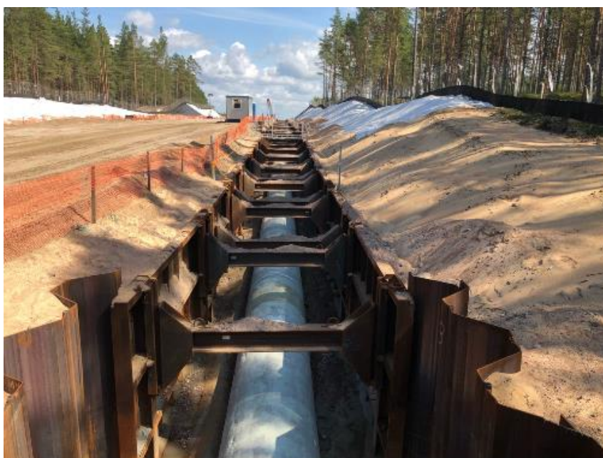
Рис. 3. Участок строительства в районе реликтовой дюны (июль 2019 г.)

На наиболее чувствительном участке (полоса прибрежных лесов протяжённостью 1,3 км) работы ведутся в коридоре шириной всего 30 м – это самый узкий из возможных коридоров для сооружения газопровода такой мощности. Для сравнения: при традиционном методе строительства ширина коридора составила бы 85 – 100 м . В районе реликтовой дюны ширина полосы отвода составила лишь 40 м .