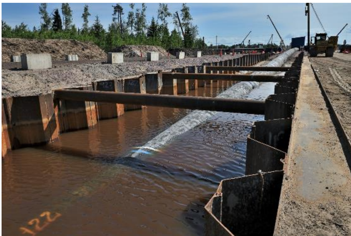
Рис. 6. Вода из траншей, разработанных при помощи тренчбоксов, не откачивается (июнь 2019 г.)

По завершении строительства и извлечения тренчбоксов, восстановительные работы будут проведены на всем участке . В безлесном состоянии с естественным напочвенным покровом будет поддерживаться лишь полоса шириной 7,5 метров над каждой плетью газопровода , в соответствии с российскими стандартами безопасности, которыми запрещается высадка деревьев вблизи газопроводов высокого давления.