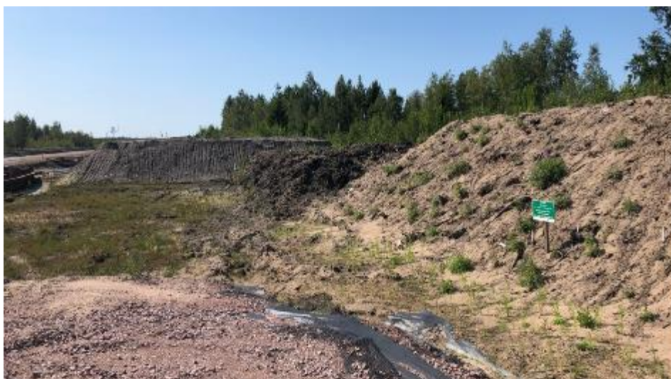
Рис. 7. Площадка хранения верхнего плодородного слоя почвы (июль 2019 г.)

Поскольку на протяжении 3.7 км линейного участка представлена мозаика почв и экосистем – от лесистой песчаной дюны до заболоченных территорий – система хранения грунта предполагает точное обозначение типа почвы и участков траншеи , с которых тот или иной слой почвы был извлечен.