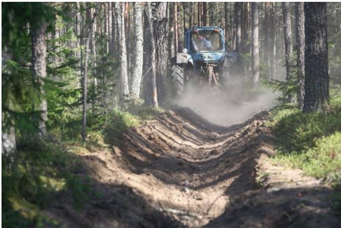
Рис. 20. Уход за минеральными полосами в Кургальском заказнике (август 2018 г.) 2019 г.)

функцию и представляют собой канавы со скошенными стенками, выкопанные до естественного минерального слоя. Поддержание минеральных полос в должном состоянии является неотъемлемым условием эффективного выполнения ими своей функции: они препятствуют распространению низового пожара в лесном массиве и таким образом способствуют сохранению биоразнообразия. В рамках проекта на всей территории Кургальского заказника было обновлено более 80 километров полос , включая распределение и выравнивание минерального слоя и их конфигурацию при помощи плуга.