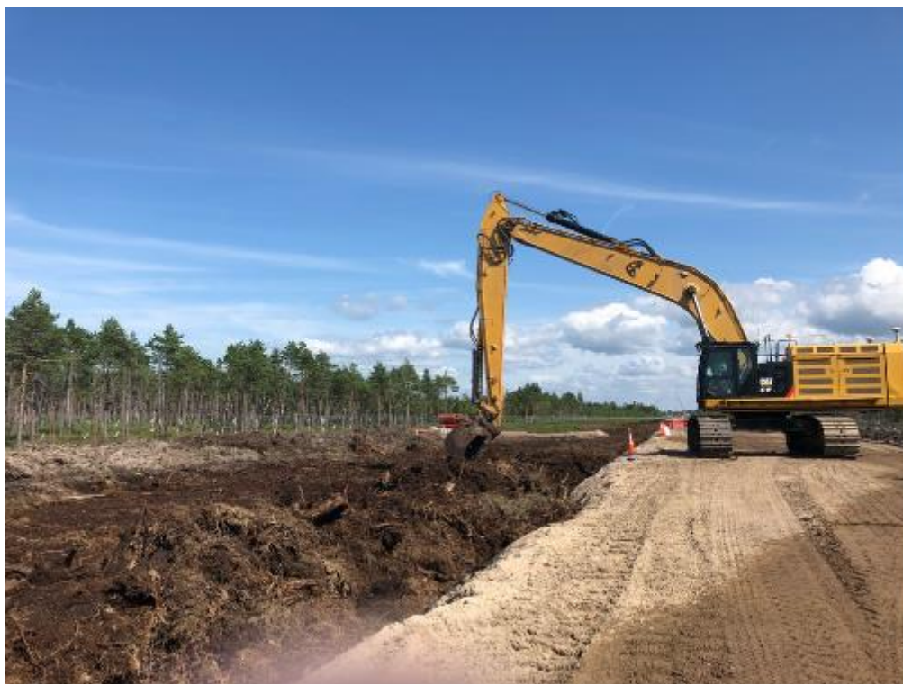
Рис. 10. Рекультивация участка – укладка торфа (июль 2019 г.)

На время строительства, пока грунт хранится в извлеченном состоянии, одной из ключевых задач для обеспечения успешности рекультивации является максимальное сохранение характеристик верхних слоев торфа , в котором находятся семена растений: необходимо не допустить его пересыхания . С этой целью подрядчиками компании проводится регулярный полив торфа , находящихся на хранении.