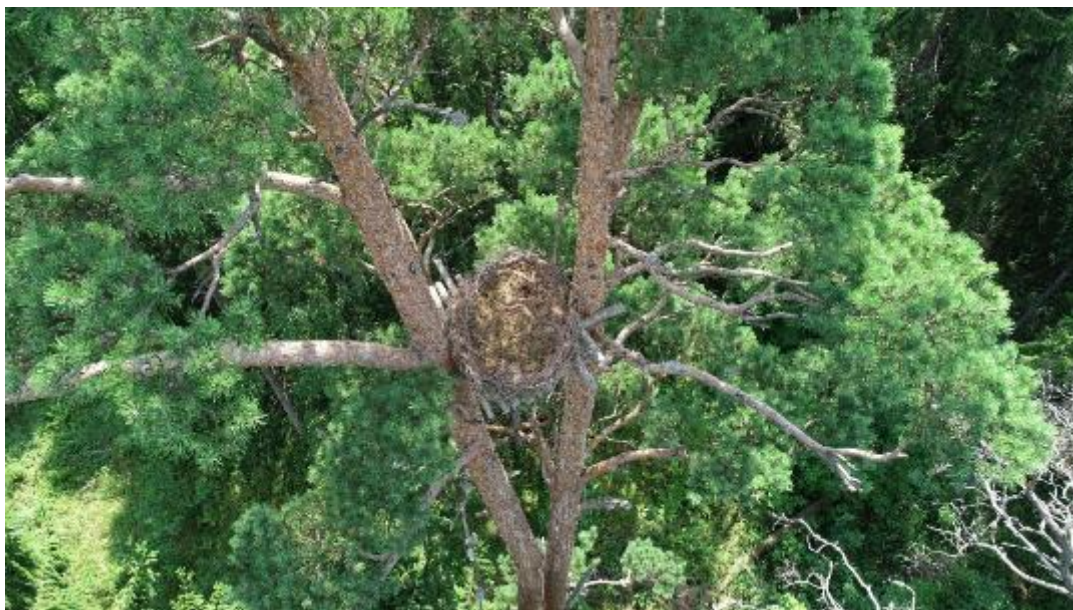
Рис. 13. Искусственные гнездовые платформы для крупных птиц установлены до начала работ (июль 2019 г.)

Наблюдения за установленными платформами , проводимые в рамках орнитологического мониторинга с привлечением ведущих региональных экспертов, зафиксировали интерес птиц к искусственным сооружениям . Мониторинг будет продолжен.