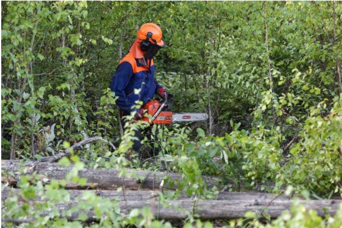
Рис. 16. Техника, работающая с использованием биоразлагаемых смазочных материалов для минимизации воздействий на биоразнообразие (сентябрь 2018 г.)