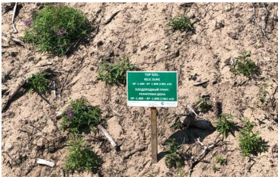
Рис. 8. Обозначение типа почвы и участка, с которого он был изъят, на площадке хранения грунта (июль 2019 г.)

Поскольку на протяжении 3.7 км линейного участка представлена мозаика почв и экосистем – от лесистой песчаной дюны до заболоченных территорий – система хранения грунта предполагает точное обозначение типа почвы и участков траншеи , с которых тот или иной слой почвы был извлечен.