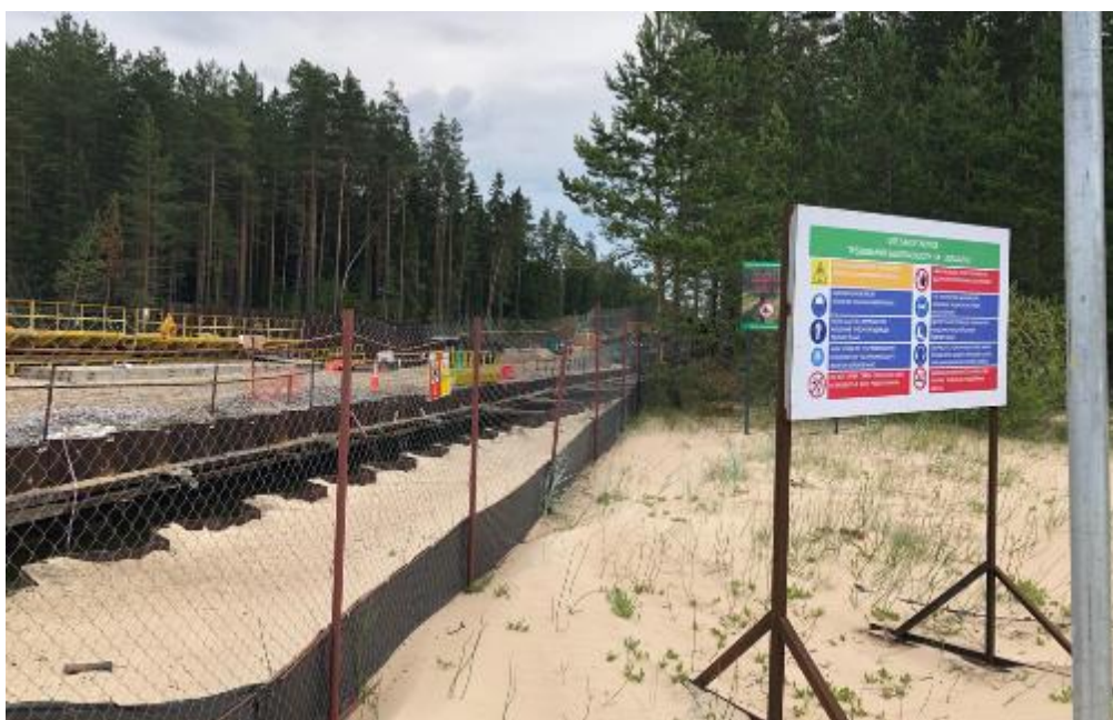
Рис. 18. Огораживание территории для предотвращения попадания диких животных (июль 2019 г.)

График строительства был оптимизирован с учетом критических периодов для морских млекопитающих, ихтио- и орнитофауны. Так, например, расчистка коридора трассы от растительности была начата только после того, как эксперты, консультирующие Nord Stream 2 по широкому кругу экологических вопросов, подтвердили, что период гнездования птиц закончился.