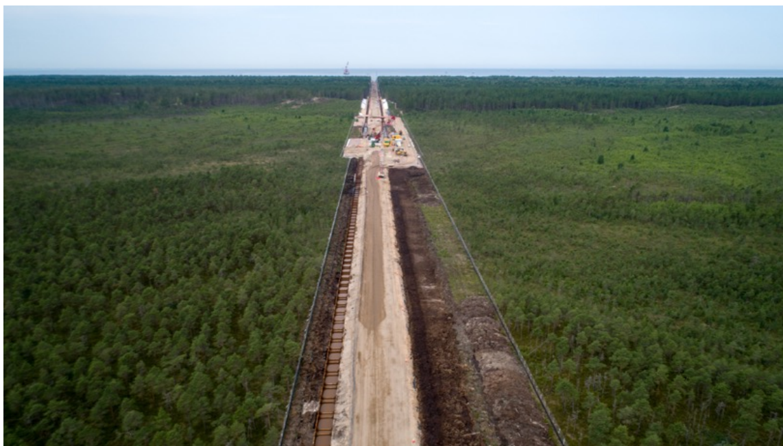
Рис. 1. Сужение коридора строительства и снижение потенциальных воздействий на окружающую среду за счет инновационного метода открытого траншейного строительства (июль 2019 г.)

Начальная точка газопровода находится на побережье Нарвского залива в Кингисеппском районе на юге Ленинградской области. Линейный участок газопровода при этом пересекает небольшую территорию протяженностью около 3,7 км в южной части Кургальского заказника , охраняемого Рамсарской конвенцией о водно-болотных угодьях, имеющих международное значение главным образом в качестве местообитаний водоплавающих птиц, и Хельсинкской конвенцией по защите природной морской среды района Балтийского моря.