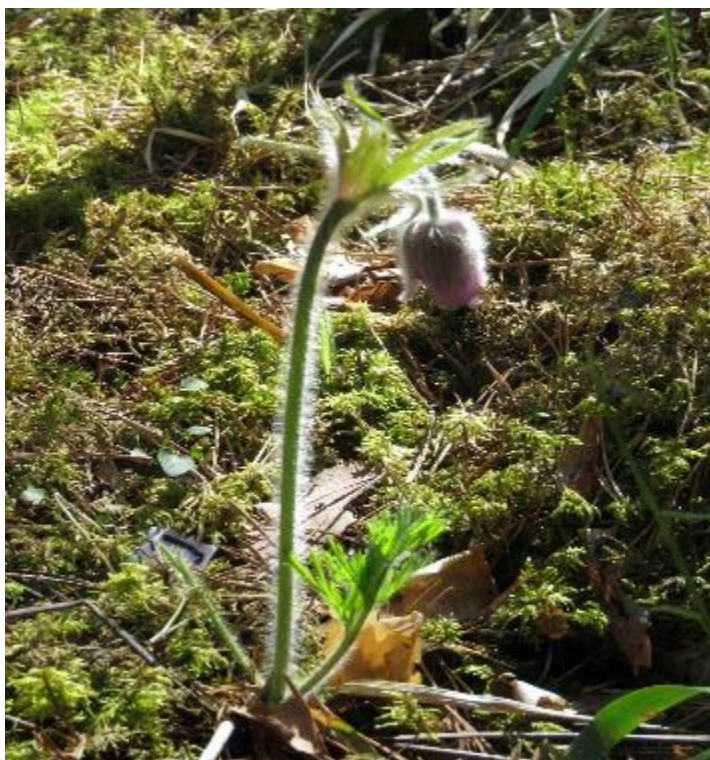
Рис. 11. Успешно пересаженный прострел луговой, Красная книга РФ (май 2019 г.)

По итогам детальных биологических исследований состояния окружающей среды и тщательного предстроительного мониторинга в коридоре строительства и рядом с ним были идентифицированы местонахождения охраняемых видов растений. В соответствии с законодательством Российской Федерации до начала расчистки коридора от растительности и строительных работ были приняты все необходимые меры по их сохранению, в т.ч. путем пересадки в другие подходящие местообитания. Данные работы были завершены в конце 2018 г. Предварительные результаты текущего мониторинга подтвердили успешность мероприятий по пересадке.